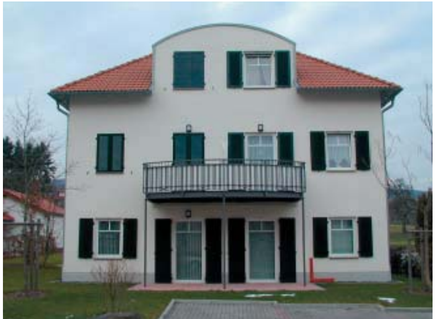
Das Originalbild von der Digitalkamera. Es enthält alle aufnahmebedingten Fehler wie Bildfeldwölbung (Weitwinkelleffekt, der von der Kamera verursacht wird) und Fluchtpunktperspektive (Verzerrung, die durch den Aufnahmestandpunkt hervorgerufen wird).